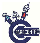
Centro per le famiglie dell'Unione dei Comuni della Bassa Romagna